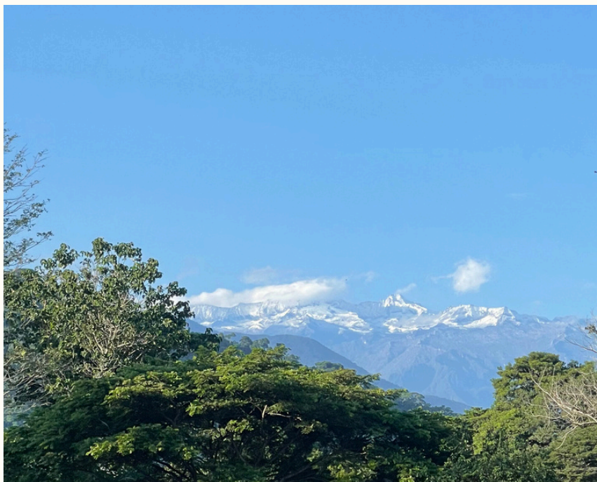
Sierra Nevada de Santa Marta, Gonawindúa — “Corazón del Mundo”. Territorio Sagrado para los pueblos Kogui, Wiwa, Kankuamo y Arhuacos.

Con todo el amor, pongo a tu servicio las herramientas y experiencias que me ayudaron a reconectar con mi verdad.